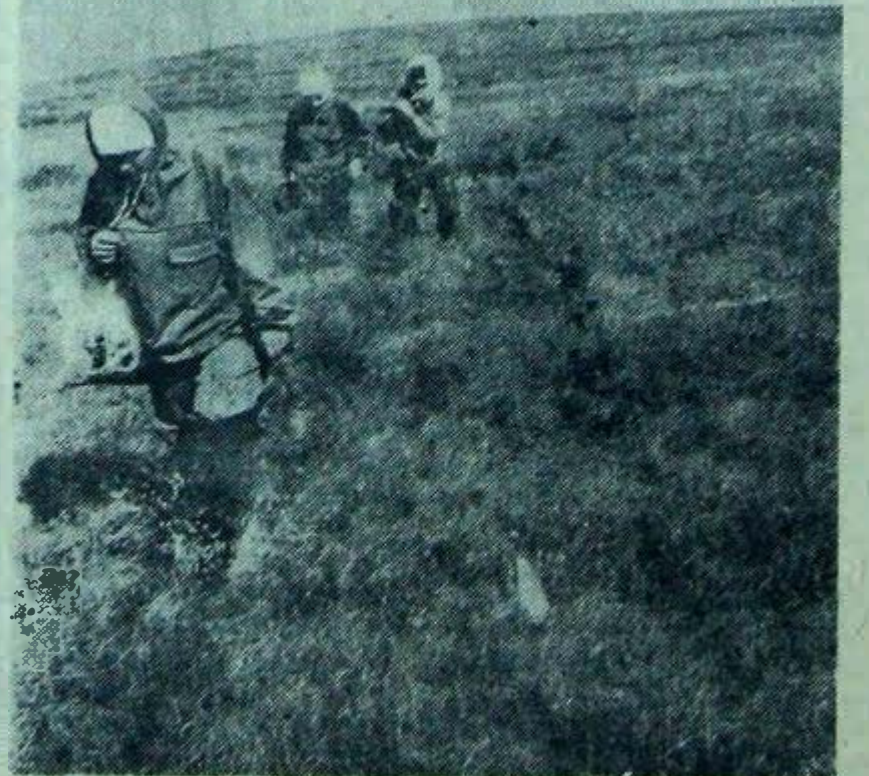
Летний маршрут — почвоведы в Таевова тундре.