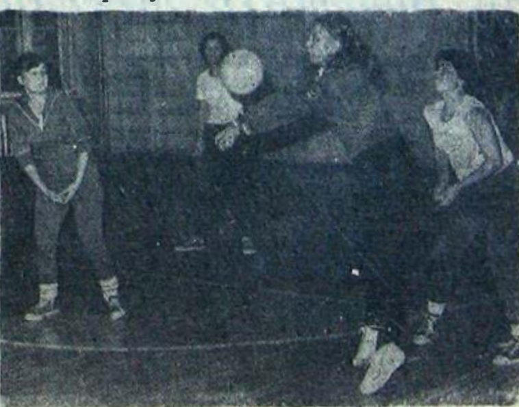
На фото: один из моментов товарищеской встречи.