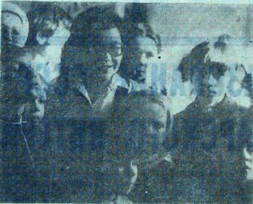
Спасибо взрослым, которые были всегда рядом.