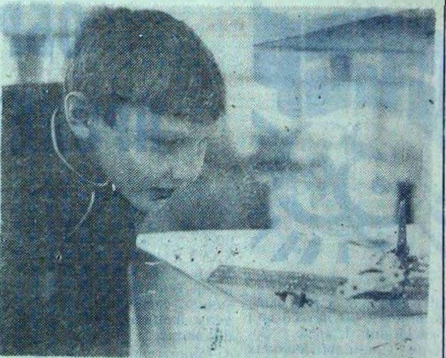
Много интересных экспонатов представлено на выставке. С интересом рассматривают дети поделки своих сверстников.

— Идея выставки замечательна, и достойно похвалы ее оформление. Хочется, чтобы такие детские выставки организовывались почаще.