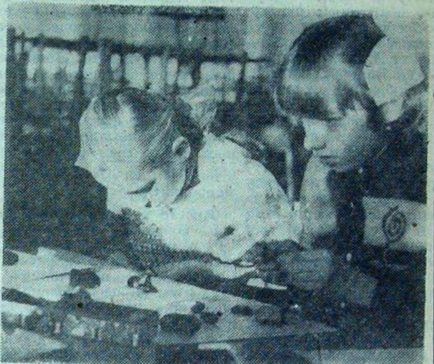
В умелых руках бесформенный кусочек пластилина становится героем любимой сказки.

И единственное пожелание, которое высказал каждый посетитель, — это чаще устраивать подобные выставки.