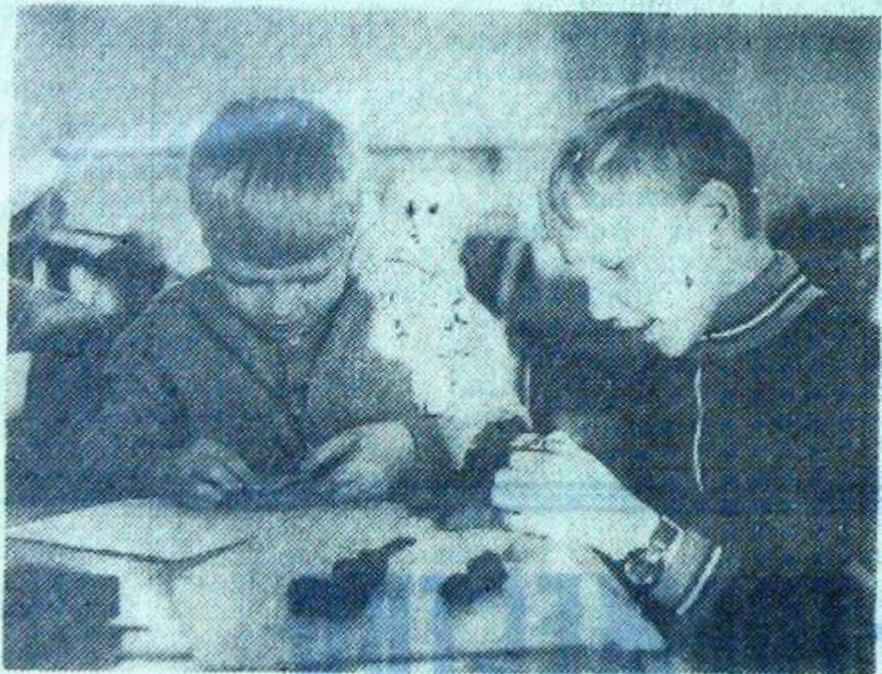
Скучать не было времени.

Любой рисунок, поделка, изготовленная руками ребенка, — это радость. Не правда ли, каждый рисунок веет на нас чистотой и искренностью, какую могут создать только дети. Поэтому нет ничего удивительного в том, что искусство малышей каждому из нас по-своему дорого. Улыбка добрая, чуть наивная, ощущается в каждом рисунке. Разглядывая их, невольно поддаешься детской затейливой мысли и чувству. На время забываешь о своих «взрослых», далеких от детства, проблемах.