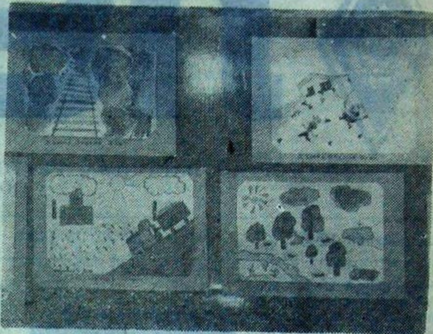
На суд зрителей — выставка художественного творчества.

В тот момент, когда родители с законной гордостью рассматривали рисунки и поделки, их дети занимались любимым делом: одни лепили затейли-