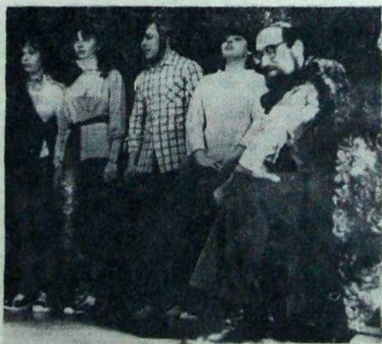
НА СНИМКЕ: Театр Сатиры, Эпизод из постановки «Из времен князя Игоря».

На мой взгляд, это вызвано тем, что уровень игры у разных артистов не одина-