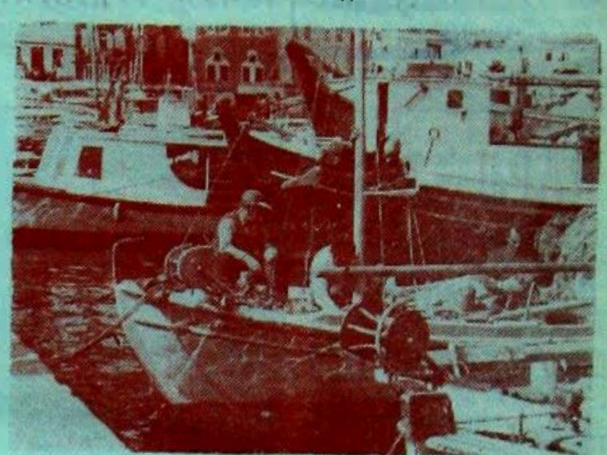
Рыбаки на острове Идра.

«Такова судьба многих», — грустно улыбнулся он. А когда прощались, он сказал слова, которые до сегодняшнего дня звучат в моих ушах: «Как же вы счастливы! Вы даже сами не понимаете, как вы счастливы...».