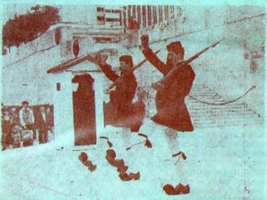
Смена почетного караула у могилы Неизвестного солдата в Афинах.

стрее взглянуть там, внизу, что-то особенно важное.