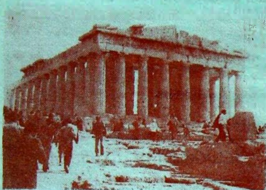
Древний и вечно молодой Парфенон.