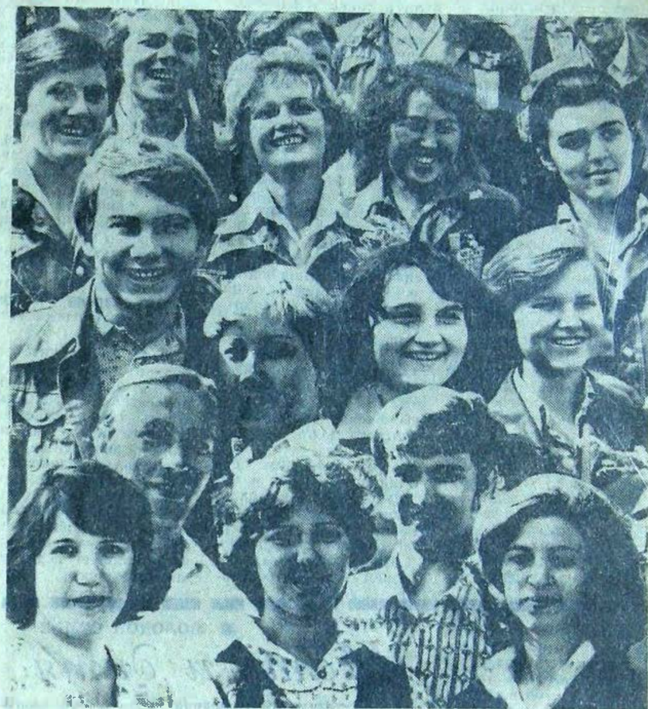
Союз студенческой молодежи выдержал испытание временем. Выдержал потому, что, провозгласив с самого начала своего пути

Международный союз студентов ведет активную пропагандистскую деятельность. Он издает ежемесячный журнал «Всемирные студенческие новости» на различных языках, журналы «Демократизация образования», «Кино и театр молодых», «Информационный бюллетень», бюллетень «Спорт», выпускает отдельные брошюры по актуальным проблемам международной жизни и международного студенческого движения.