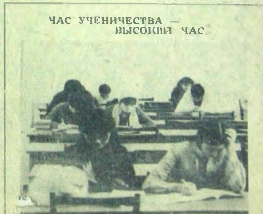
ЧАС УЧЕНИЧЕСТВА — ВЫСОКИЙ ЧАС