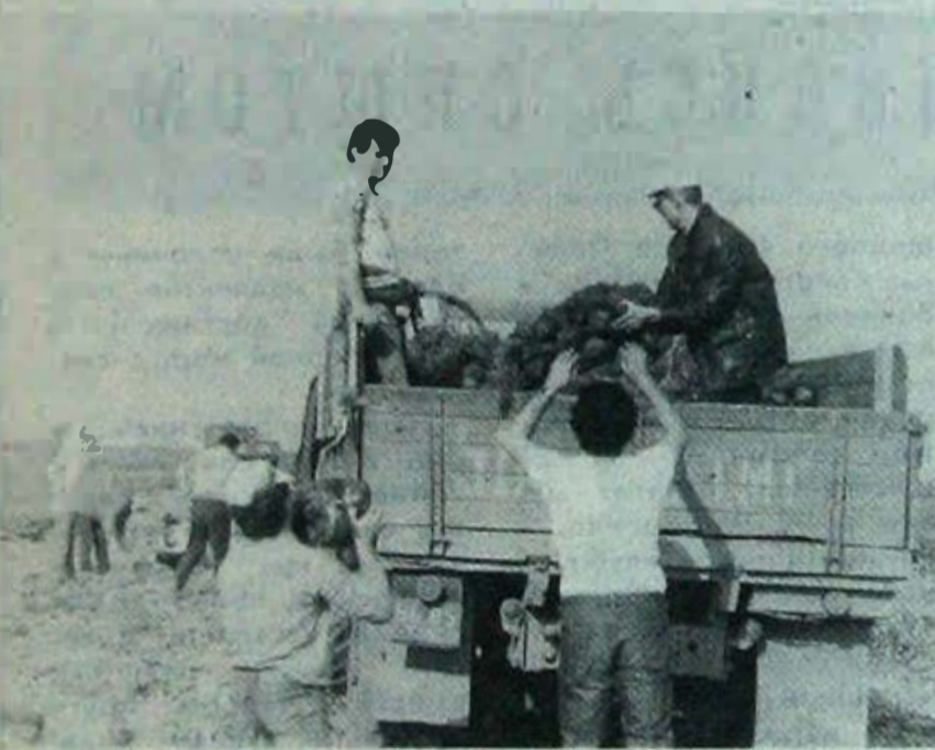
Вспоминаю времена атлантов, или Работа для настоящих мужчин.