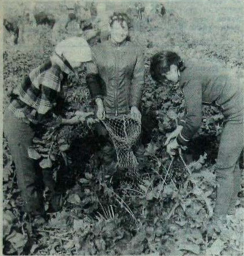
Внимание социологов: изучайте влияние настроения на производительность труда!