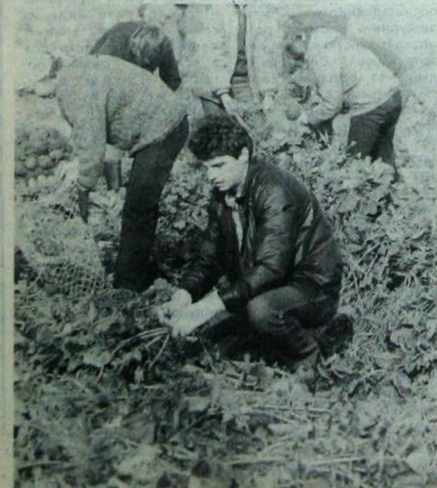
Белые перчатки — незаменимая вещь на сельхозработках. (Из жизни аристократов).

Наступили дождливые дни. Но уборка урожая в подшефных совхозах университета продолжается. Нелегко пришлось поначалу нашим первокурсникам. Ведь многие из них впервые выехали на уборочные