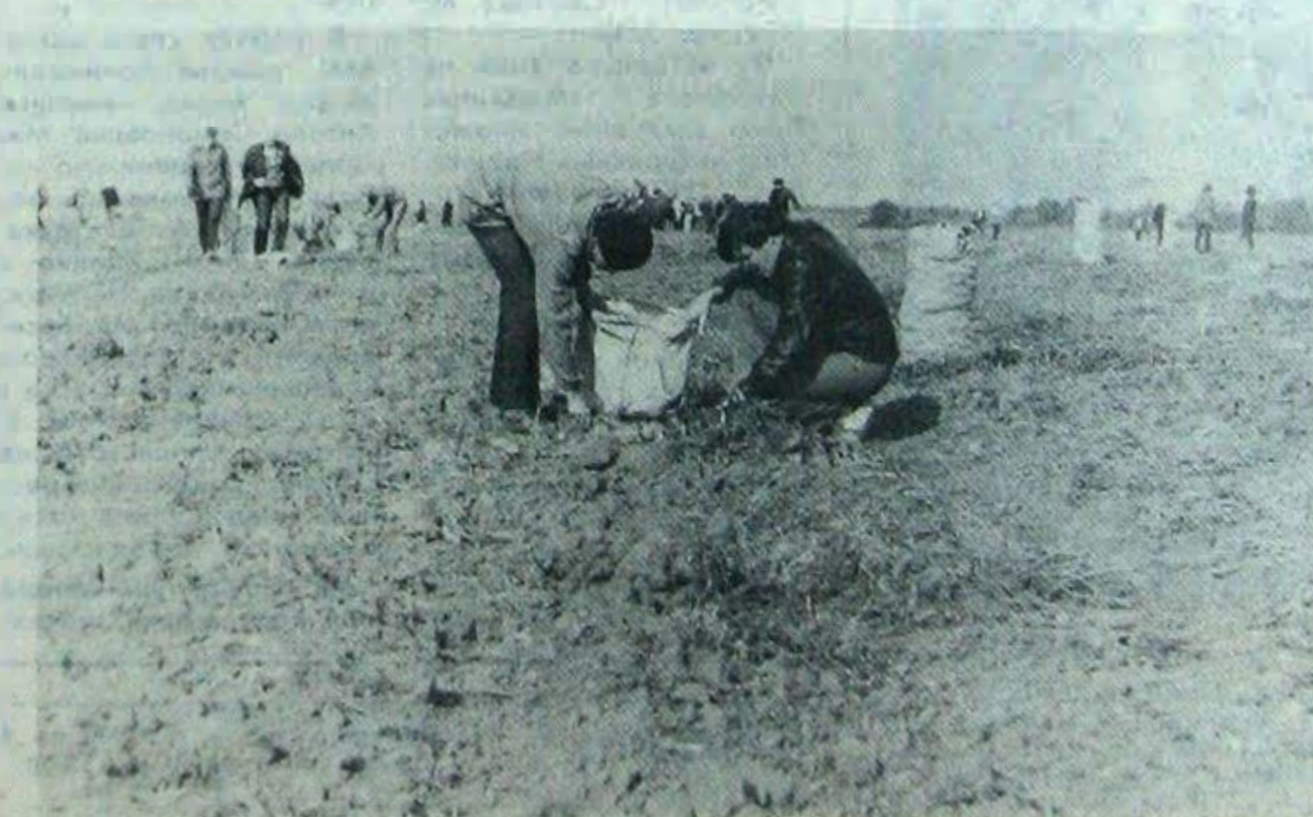
Приятно видеть плоды собственного труда — оставлять убранные поля.