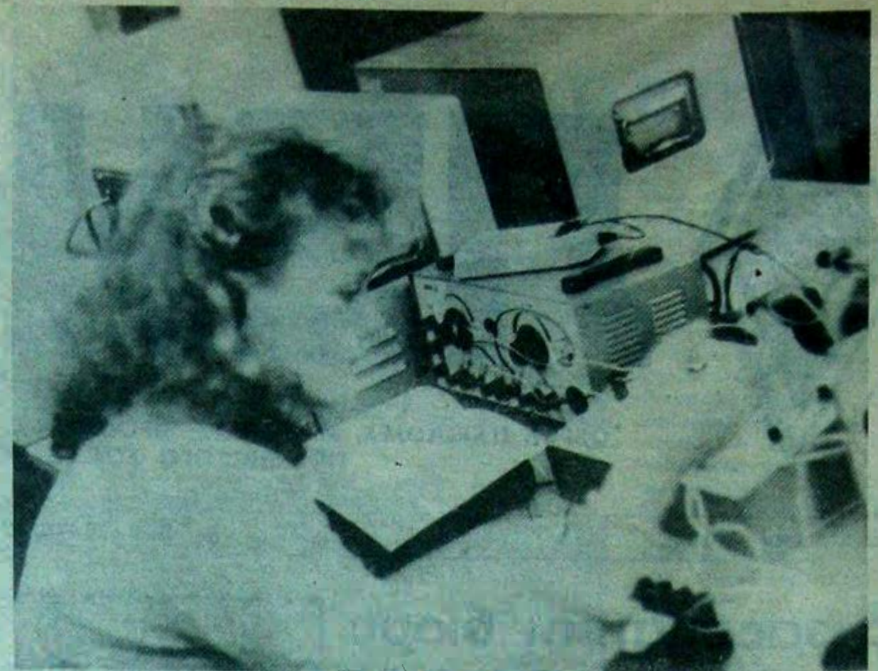
Специфика обучения на физическом факультете привлекает не только юношей.

Без особых материальных затрат можно решить и другие давние проблемы. Например, трудно поверить, что университету не под силу обеспечить все комнаты обычными громкоговорящими для радиосеты, однако многие студенты лишены возможности их слушать. В комнатах 505