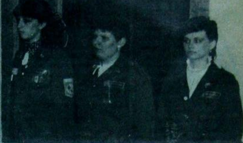
на предприятиях и полевых станциях. На этом снимке вы видите участников одной из агитбригад ТГУ.