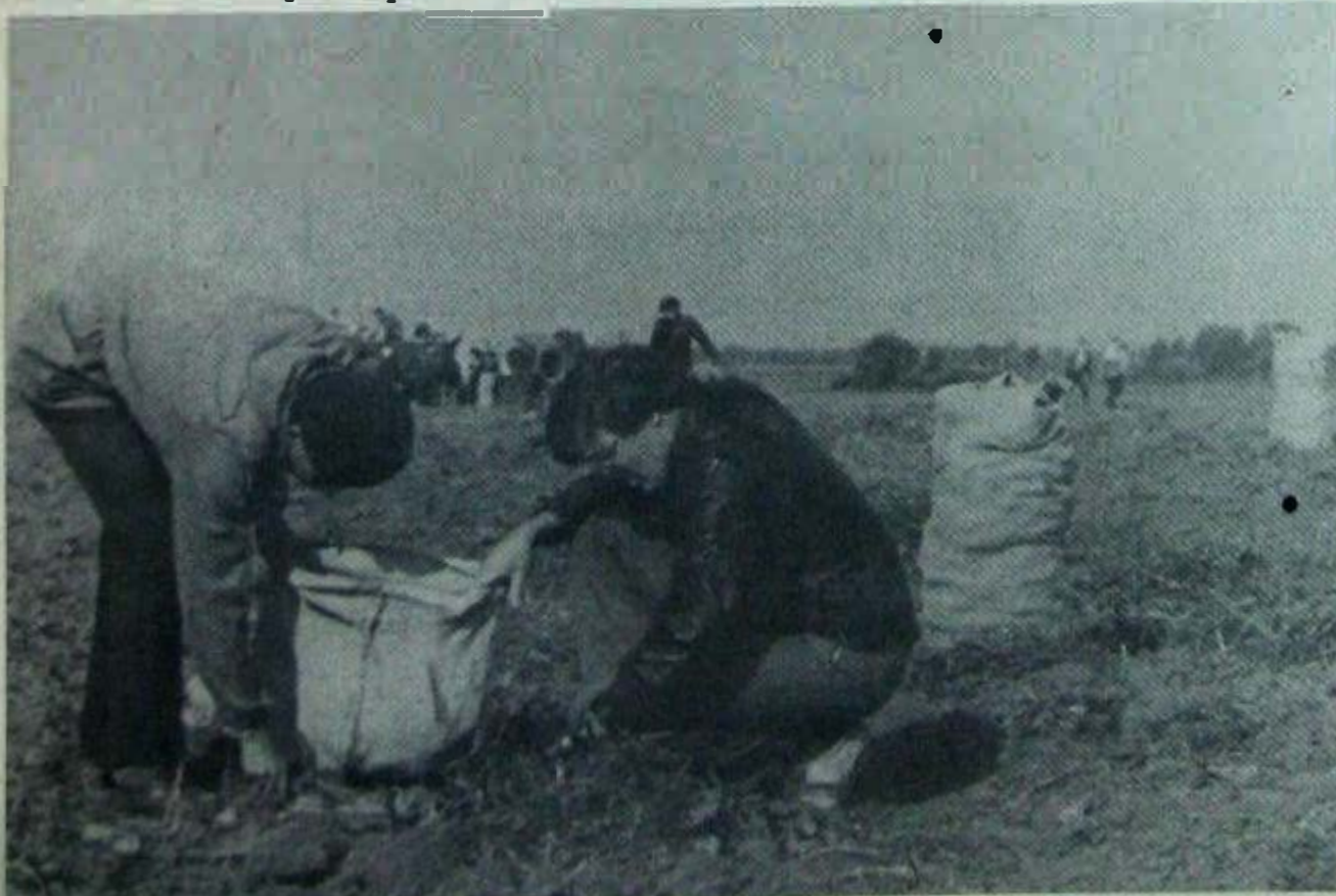
На полях совхоза «Борковский».