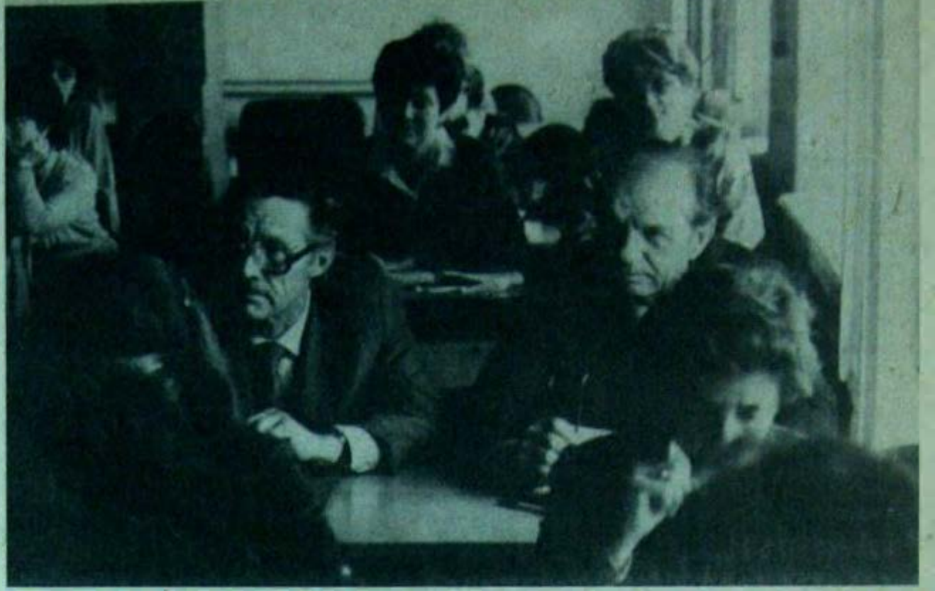
На факультете романо-германской филологии прошло профсоюзное собрание. На нем были обсуждены наиболее волнующие вопросы факультета.

Пожелаем же нашим девушкам удачных стартов в соревнованиях, успешной учебы в вузе! И. МАНЖЕЛЕЙ, председатель спортклуба ТюмГУ.