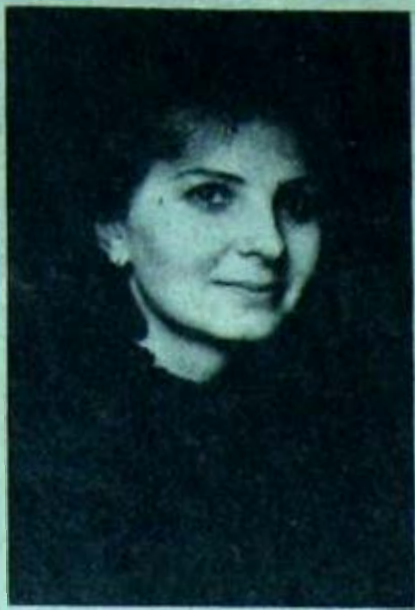
сказали — промолчал и не сделал».

4. Меньше формализма. Сейчас начался новый учебный год, и комитет требует годовую справку. Хотя уборка, хоть что: справка — обязательна! Но мне нравится комсомольская работа. Заинтересованность появляется тогда,