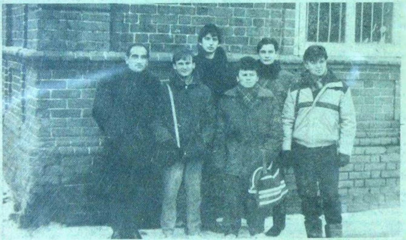
НА СНИМКЕ: постоянная группа студентов-историков, работающих на строительстве студенческого клуба.