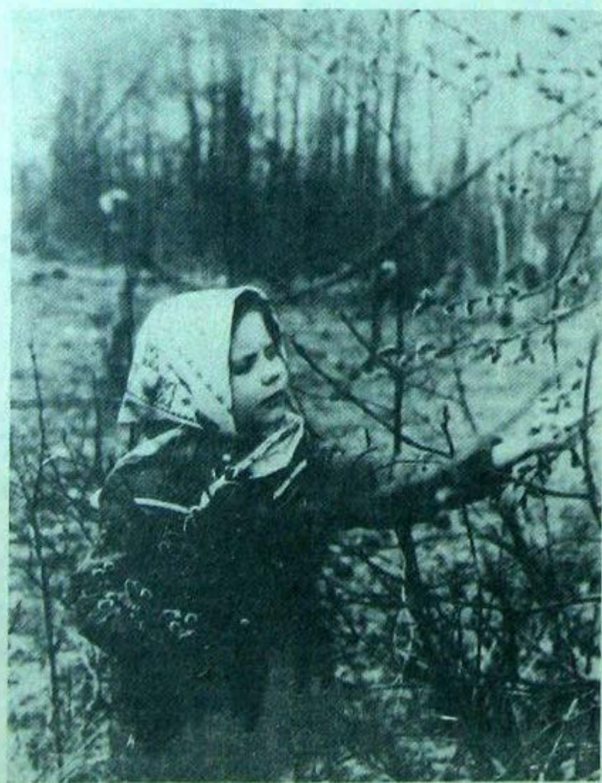
А сердце сильно так в груди Стучит, как будто ждет чего-то, Как будто счастье впереди, И унесла зима заботы.