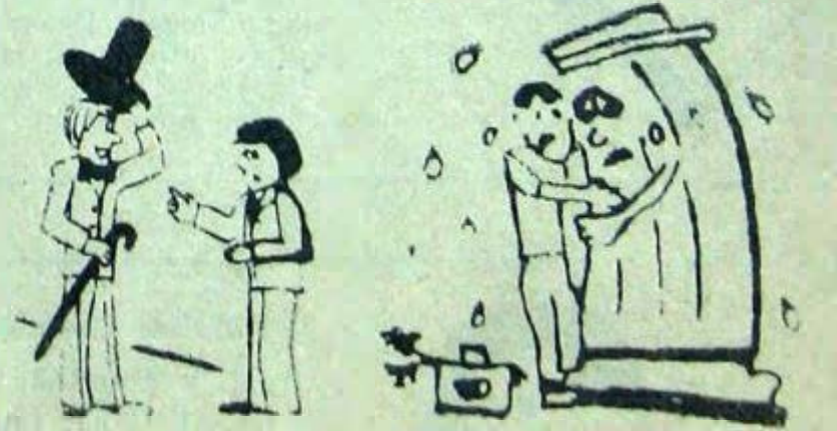
— Ну, куда распределитесь? — В Париж! — Прощайте с Алла Матер Рисунки М. ПАСГУХОВОЙ.