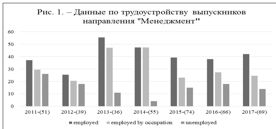
Рис. 1. Данные по трудоустройству выпускников направления Менеджмент.

В ТюмГУ ситуация с трудоустройством выпускников в целом отражает сложившиеся тенденции в стране. Данные о трудоустройстве выпускников направлений «Менеджмент» и «Экономика» в целом по направлению и по профилю обучения, а также их изменения за 2011-2017 гг. представлены на рис. 1 и 2.