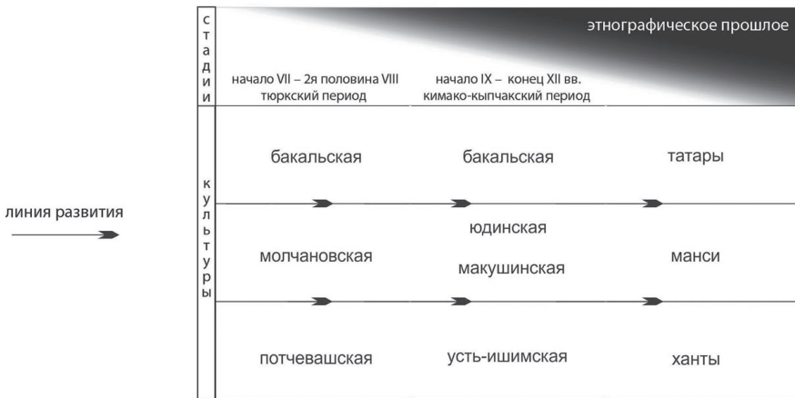
Рис. 1. Классическая (линейная) периодизация эпохи Средневековья