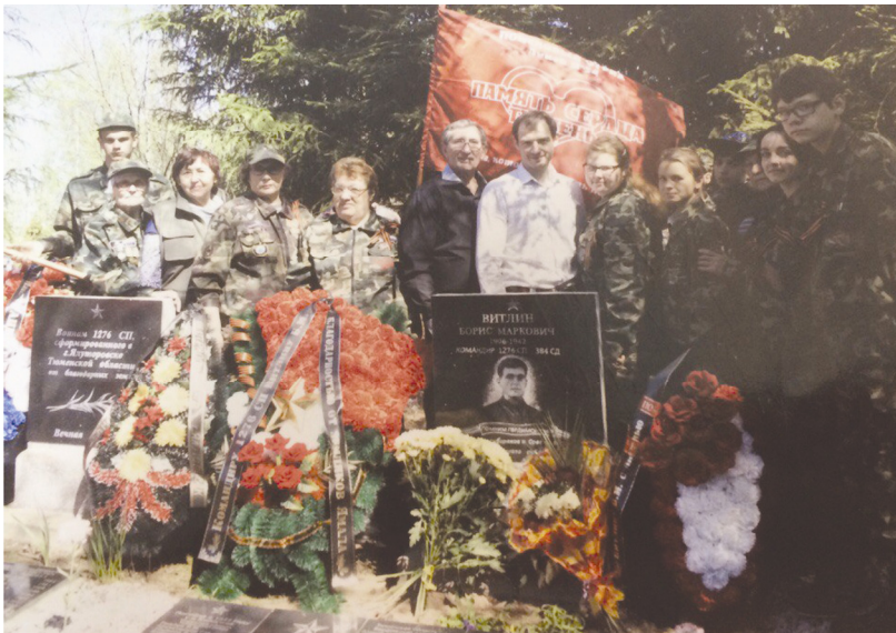
Рис. 3. Памятный знак Б. М. Витлину

Из воспоминаний Михаила Дмитриевича Нохрина, бойца 1276 СП 384 СД (10.03.1984 г. город Тюмень): «Полком сибиряков командовал кадровый офицер, коммунист Борис Маркович Витлин, погибший в атаке 25 февраля 1942 г. у д. Бологижа, под г. Старая Русса. Партийный билет командира был пробит пулями и обогрен кровью героя 1 .