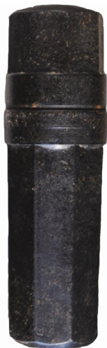
Рис. 1. «Смертный медальон»

в такой капсуле плохо сохранялся. Изготавливались и металлические капсулы круглой и прямоугольной формы (рис. 1).