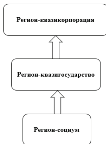
Рис. 1. Направление развития регионов