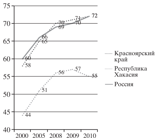
Рис. 2. Динамика вторичной модернизации регионов Восточной Сибири и России

инженеров, полностью занятых в НИОКР и числа жителей региона, подавших патентные заявки. В индексе трансляции знаний отмечено снижение значения индикаторов, характеризующих число телевизоров и персональных компьютеров на 100 домохозяйств, что, на наш взгляд, может быть вызвано определёнными погрешностями при сборе статистических данных. Небольшая отрицательная динамика наблюдается в индексе качества жизни. Весьма значительное снижение показали составляющие индекса качества экономики: ВВП на душу населения (особенно снизился ВВП на душу населения по паритетной покупательной способности) и доли лиц, занятых в материальной сфере (сельское хозяйство и промышленность), в общей занятости.