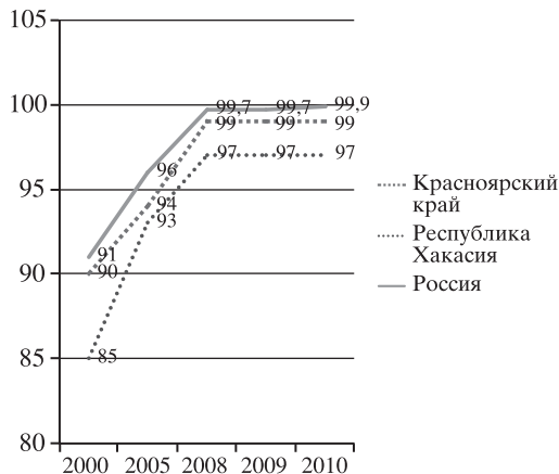
Рис. 1. Динамика первичной модернизации регионов Восточной Сибири и России