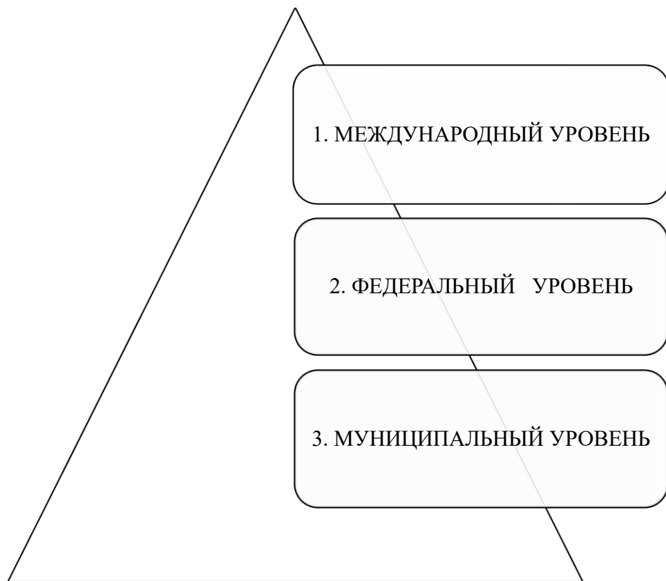
Рис. Система законодательства и иных нормативных правовых актов о туристской деятельности

В настоящее время система законодательства и иных нормативных правовых актов о туристской деятельности выделяется по уровню действия (рис.).