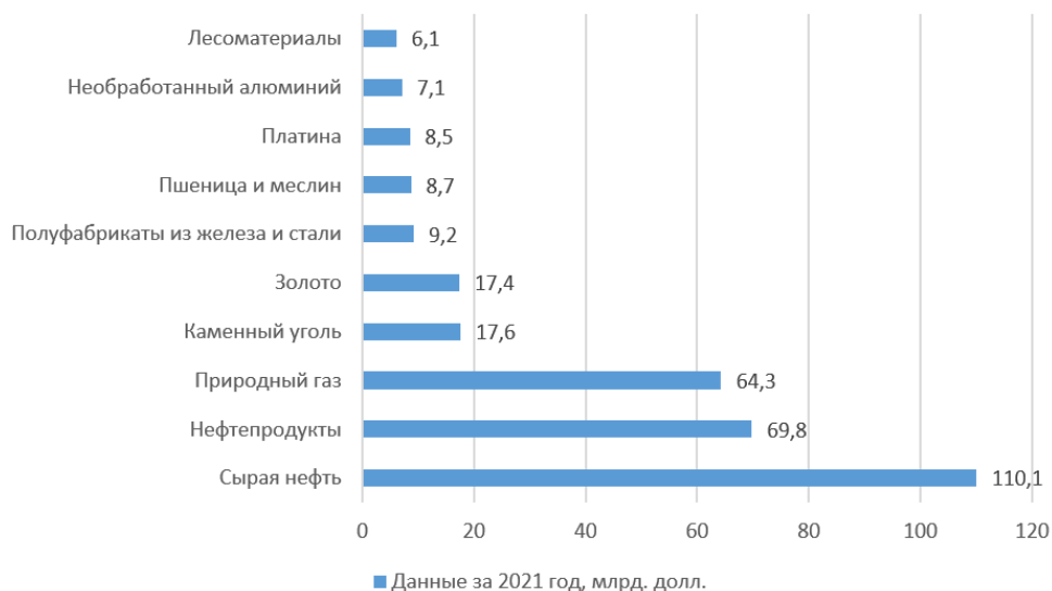
Рис. 1. Какие товары больше всего Россия продавала за рубеж в 2021 г.

Рассмотрим какие товары принесли России в 2021 г. больше всего экспортных доходов (рис. 1).