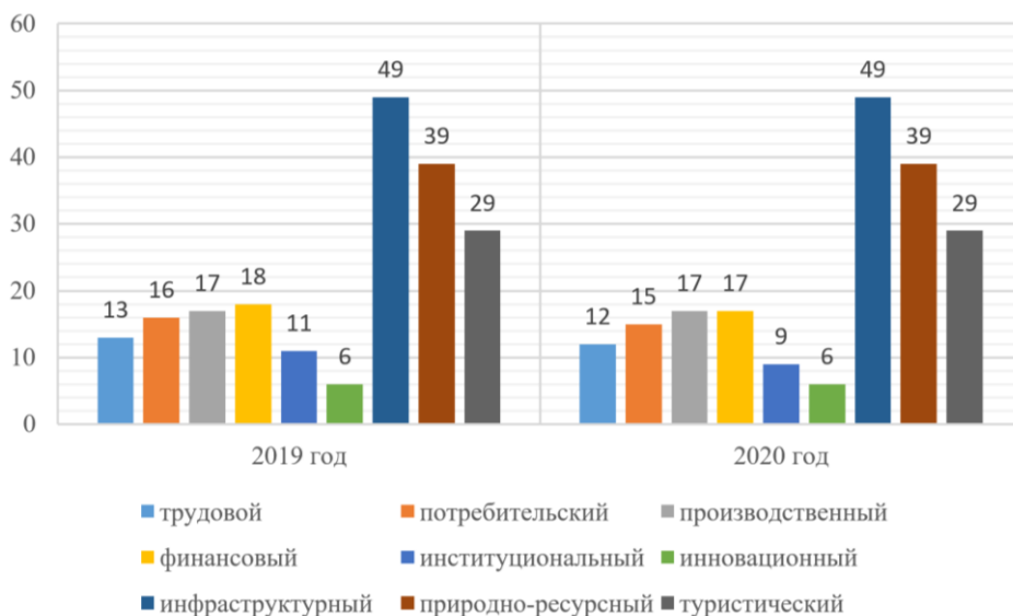
Рис. 2. Динамика изменения рангов, составляющих инвестиционный потенциал

В 2019 и 2020 гг., анализируемый регион в рейтинге инвестиционного потенциала субъектов РФ занимает 15 позицию. Динамика изменения рангов, составляющих инвестиционный потенциал, приведена на рисунке 2.