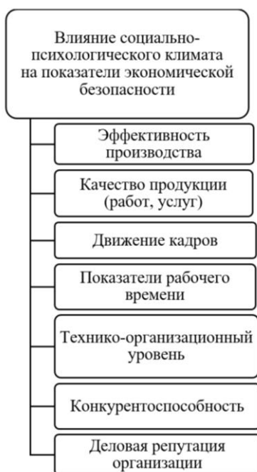
Рис. 1. Влияние социально-психологического климата на показатели экономической безопасности организации

трудовых ресурсов, хорошо выстроенную систему управленческих коммуникаций и целесообразность деятельности. Также в ходе анализа было выявлено, что предприятие является финансово устойчивым, ликвидным, платежеспособным и конкурентным.