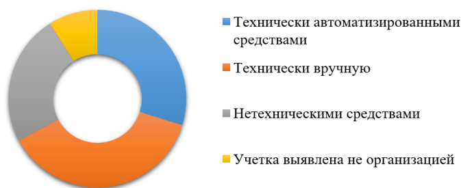
Рис. 3. Способы выявления утечки информации организации в 2020 г.