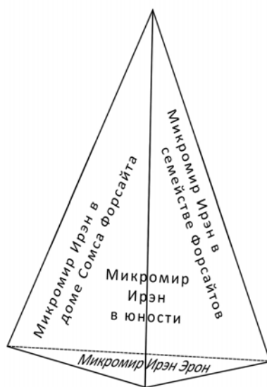
Рис.3. Внешние миры Ирэн Форсайт

Схематически (рис. 3) представим внешние миры Ирэн Форсайт в виде пирамиды (4 внешние грани символизируют 4 микромира Ирэн Форсайт).