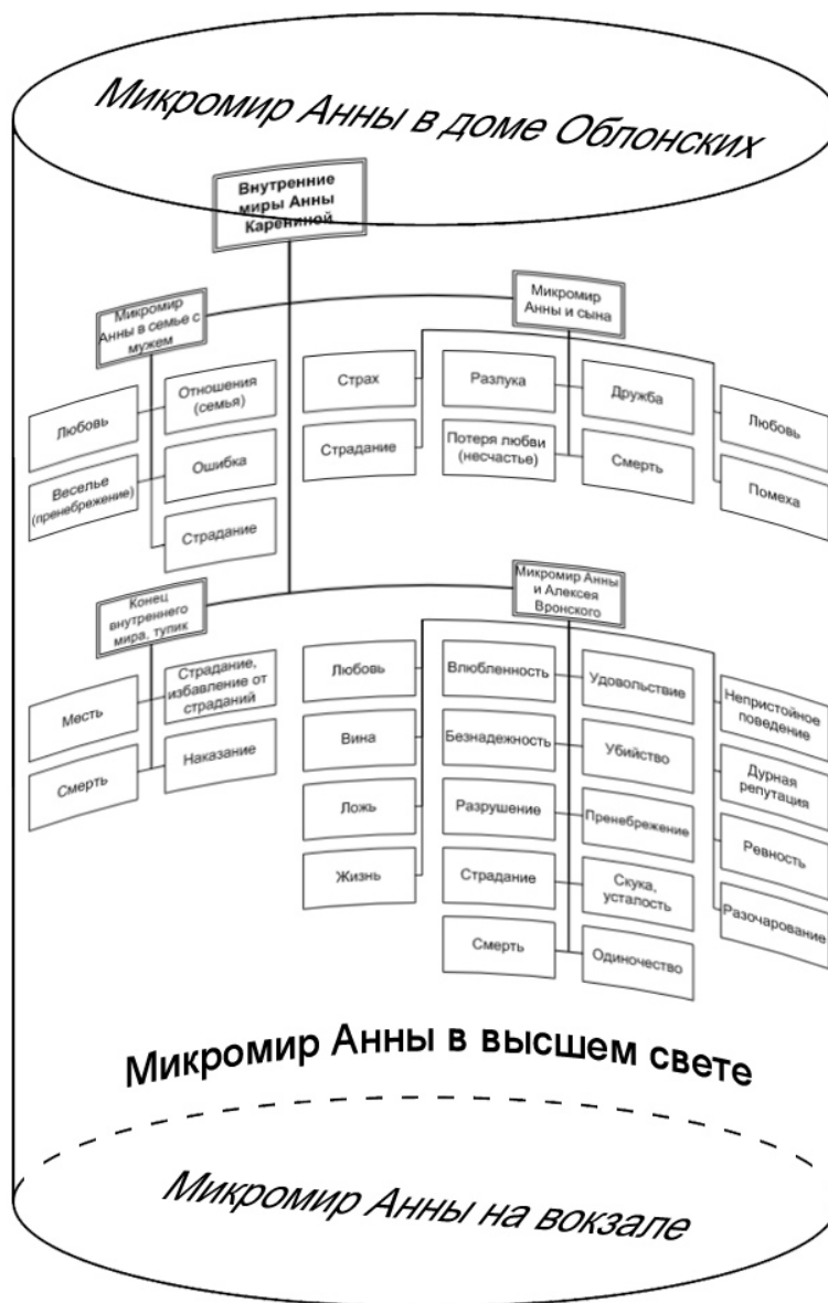
Рис.4. Схема многомирия Анны Карениной

Проанализированные микромиры позволяют нам свести данные в схемы многомирия Анны Карениной и Ирэн Форсайт, наглядно очерчивающие их контуры: