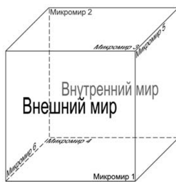
Рис 1. Многомирие персонажа

Во второй главе «Реализация многомирия в произведении Л.Н. Толстого «Анна Каренина»» мы представляем разработанную нами общую схему, интерпретирующую существование в произведении сразу нескольких миров персонажа.