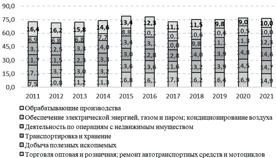
Рис. 2. Динамика показателей структуры налога на имущество организаций и транспортного налога с организаций по основным видам деятельности, % к итогу

Однако в разрезе разных отраслей воздействие имущественных налогов на инвестиционный процесс может различаться (рис. 2).