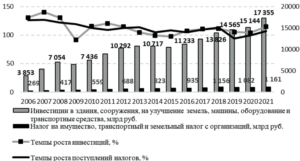
Рис. 1. Динамика показателей инвестиций в основной капитал и имущественных налогов

в бюджет имущественных налогов и инвестиций в основной капитал в 2006–2021 гг. представлена на рис. 1.