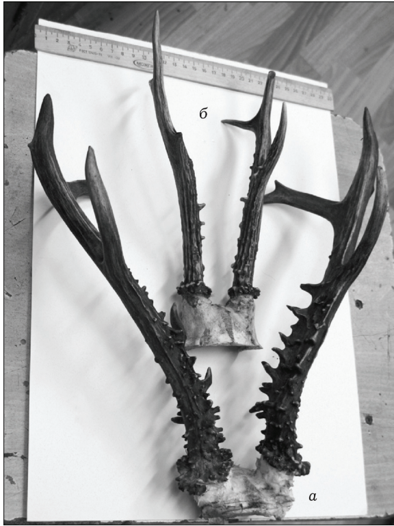
Рис. 1. Крайние варианты рогов сибирской косули с административного юга Тюменской области: а – сибирский тип, б – европейский тип

Отдельный интерес представляет появление в популяции косуль аномальных экземпляров с признаками альбинизма в окраске, с уродствами в строении рогов у самцов или даже появление рогов у некоторых самок, что может свидетельствовать о серьезных нарушениях гормонального фона. В литературе такие явления часто приписываются гибридизации сибирской и европейской косуль. Однако, как мы указали выше, явление такой гибридизации в районе работ можно считать практически невозможным. Следовательно, причины явления иные, до настоящего времени полностью не установленные.