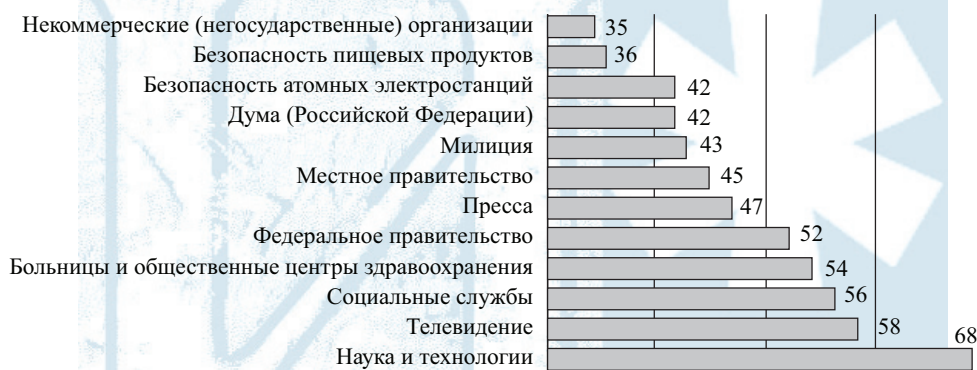
Рис. 1. Средние значения частных индексов институционального доверия ( I_d ) (100 — все полностью доверяют, 0 — все полностью не доверяют)

Для оценки уровня институционального доверия респондентам предлагался список социальных организаций, играющих важную роль в жизни российского общества. Респонденту необходимо было оценить, насколько он доверяет или не доверяет каждому из них. Средние значения частных индексов институционального доверия приведены на рис. 1.