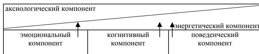
Схема 1. Структура социального самочувствия

В общем виде структуру социального самочувствия схематично можно отобразить следующим образом (Схема 1):