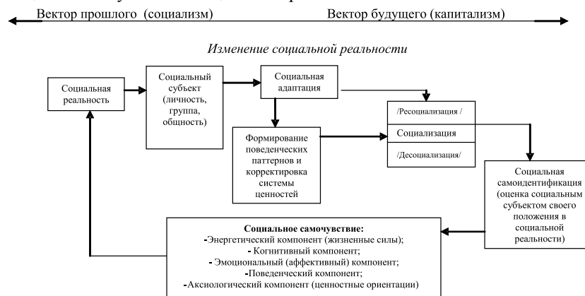
Схема 2. Блок-схема факторной модели социального самочувствия в условиях изменяющегося общества

ния установок социального субъекта по отношению к существующим нормам и ценностям) и формирование определенного социального паттерна, оказывающие влияние на оценку социальным субъектом своего положения в социуме. Данный процесс обуславливает характер социального самочувствия и мотивацию социальных действий, а также самоидентификацию социального субъекта в социальной реальности.