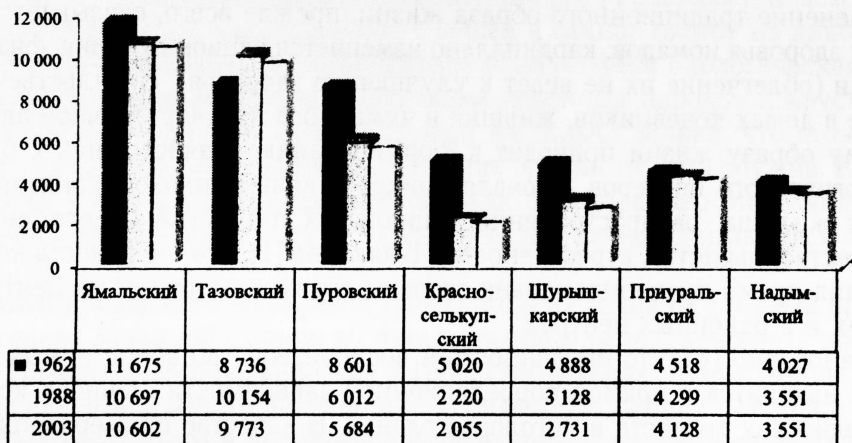
Рис. 2. Динамика учетной площади пастбищ по районам Ямало-Ненецкого автономного округа, тыс. га

Снижение поголовья оленей за исследуемый период необходимо рассматривать во взаимосвязи с динамикой площади оленьих пастбищ. За последние сорок лет учетная площадь оленьих пастбищ по всем районам традиционного хозяйствования сократилась на 8,97 млн га или на 18% по отношению к площади в 1962 г. (рис. 2) [7]. Наибольшее выбытие пастбищных угодий произошло в Красноселькупском, Шурышкарском и Пуровском районах.