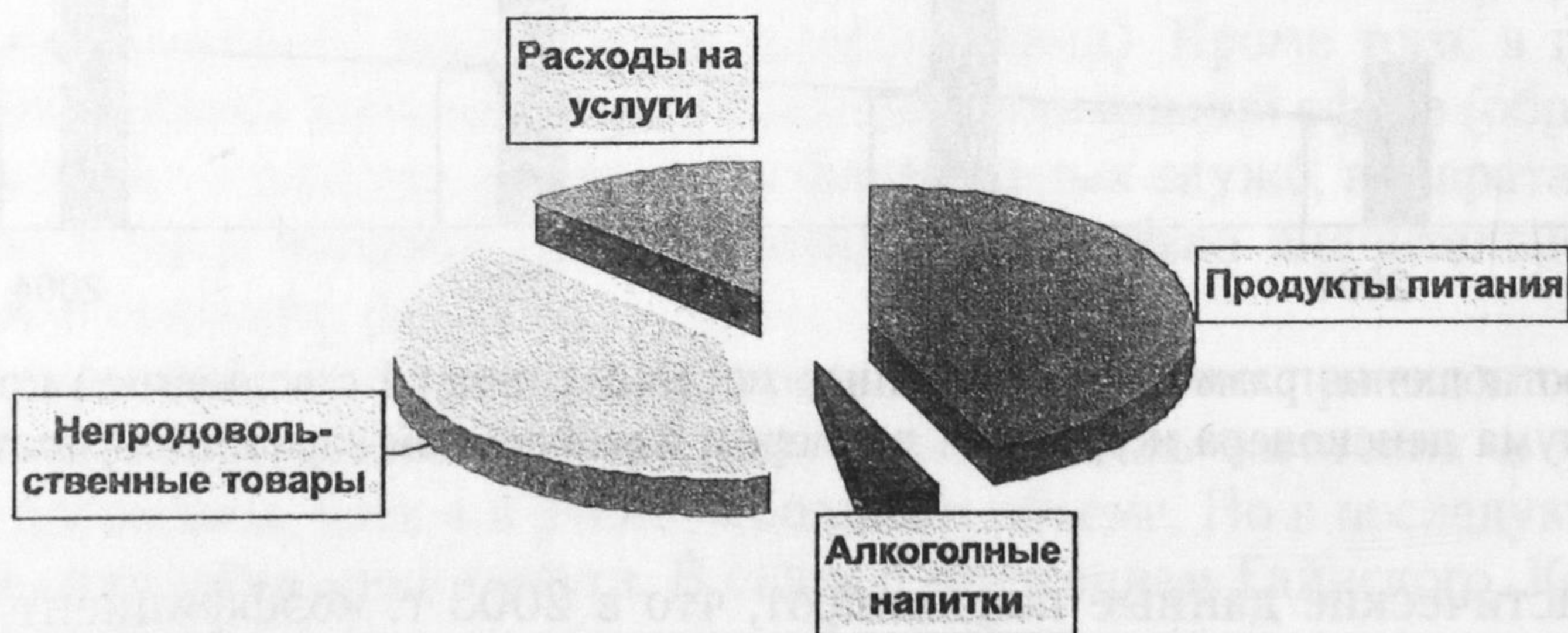
Рис. 6. Структура потребительских расходов домашних хозяйств, 2004 г. (по материалам выборочного обследования бюджетов домашних хозяйств), %

От среднедушевых денежных доходов населения зависит его покупательная способность, т.е. его потенциальная возможность по приобретению товаров и услуг, выраженная через товарный эквивалент среднемесячных денежных доходов. В структуре расходов населения значительную долю (56%) занимает приобретение продуктов питания и оплата коммунальных услуг (рис. 6). Основными продуктами питания населения Коми-Пермяцкого округа являются хлебобулочные изделия, молоко и яйцо (за счет ведения домашнего хозяйства), картофель и овощи (за счет приусадебных и дачных участков). В 2004 г. в рационе питания несколько уменьшилось потребление картофеля, масла растительного и других жиров. В целом можно сделать вывод, что у среднестатистического жителя округа рацион питания разнообразный, т.к. 76% жителей — сельское население, и даже часть городского населения, проживающая на окраинах города, содержит домашний скот.