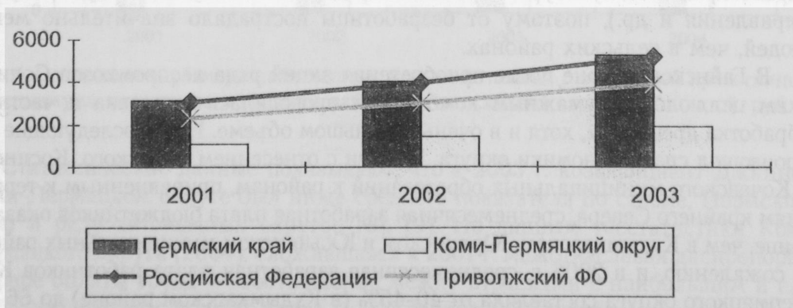
Рис. 1. Среднегодовые денежные доходы населения, в месяц, руб.

Основным доходом населения Коми-Пермяцкого округа являются оплата труда наемных работников и пенсии нетрудоспособного населения. Несмотря на некоторый рост денежных доходов населения округа с 2001 по 2003 гг. [8], [1], все же они ниже показателей Приволжского Федерального округа в 2 раза, в 2,7 раза ниже показателей по Российской Федерации и Пермскому краю (рис. 1). В 2005 г. среднедушевые доходы населения округа составили 2404 руб. в месяц, что почти в 2 (1,8) раза ниже окружной среднемесячной номинальной заработной платы.