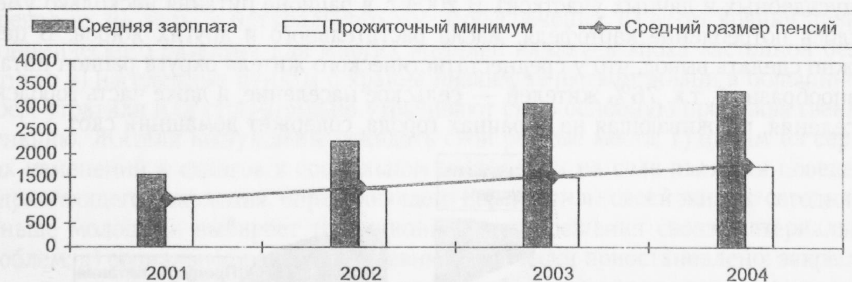
Рис. 4. Соотношение размера назначенных месячных пенсий с величиной прожиточного минимума пенсионера и средним размером начисленной заработной платой, руб.

Самый низкий доход остается у пенсионеров округа. Из анализа рис. 4 можно сделать вывод, что средний размер пенсий в 2004 г. по сравнению с 2001 г. вырос в 1,7 раза. Но в связи с инфляцией реальный их размер за это же время снизился на 7,5%. Следовательно, несмотря на ежегодное повышение пенсий, его размер остается на уровне прожиточного минимума пенсионера.