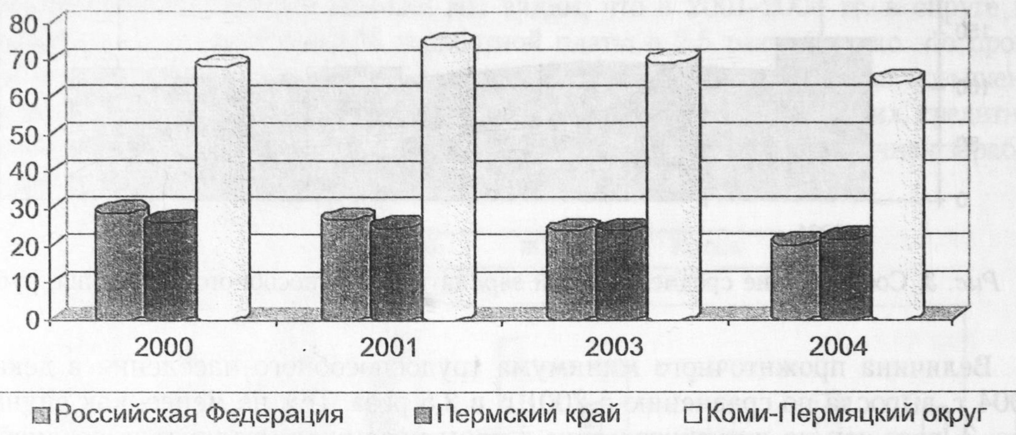
Рис. 5. Численность населения с денежными доходами ниже величины прожиточного минимума, % от общей численности населения региона

Для оценки дифференциации населения по доходам Всероссийским центром уровня жизни была разработана система потребительских бюджетов, в которую, помимо прожиточного минимума (ПМ), входят минимальный потребительский бюджет (МПБ) и бюджет высокого достатка [9]. Согласно этой методике, в 2000–2003 гг. от 68,5 до 64,3% населения Коми-Пермяцкого округа имели доходы ниже прожиточного минимума (рис. 5).