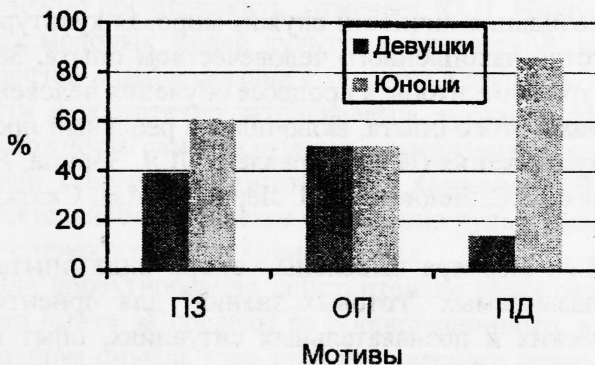
Рис. 2. Соотношение юношей и девушек 4 курса в выборе доминирующих мотивов обучения (%). Обозначения те же.

При этом понижается число девушек и возрастает количество юношей, считающих профессию специалиста в области физической культуры и спорта важной и перспективной (с 53% до 45% и с 29% до 37% соответственно).