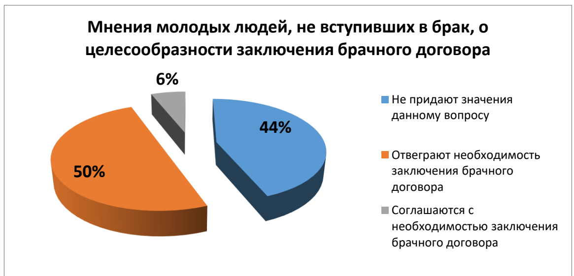
Рис. 1 Результаты опроса юношей и девушек, не состоящих в браке

Отметим, что при заключении брака вопрос о возможных спорах относительно материальной стороны в условиях совместного проживания, как правило, интересует молодоженов меньше всего. Супруги не задумываются о том, что в будущем возможен раздел совместно нажитого имущества. Они считают, что в их случае такого не может и не должно произойти, так как искренне любят своего партнера и мотивируют свою позицию определенными предубеждениями о том, что в их ситуации все будет по-другому, на высшем уровне. О таких сведениях свидетельствуют результаты проведенного в ходе исследования социологического опроса в г. Тюмени. Так, нами опрошены юноши и девушки (50 человек), которые еще не вступили в брак, но находятся в таком возрасте, когда уже планируют изменение своего социального статуса. В ходе опроса установлено следующее: 22 молодых людей никогда не задумывались о том, что следовало бы заключить брачный договор перед вступлением в брак; 25 человек отметили, что для них такой необходимости, связанной с заключением брачного договора, не имеется; только 3 человека указали на то, что следовало бы заключить такой брачный договор. Изложенные данные представлены наглядно на рисунке 1.