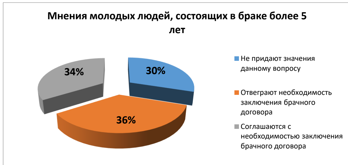
Рис. 3 Результаты опроса лиц, состоящих в браке более 5 лет

обеспечивают семью (в основном мужчины) и имеют достаточно высокое материальное благосостояние. В такой ситуации опрошенные указали, что заключение брачного договора позволит им сохранить большую часть того материального состояния, которое они заработали благодаря своему личному труду. И эти люди не считают равнозначным вклад их вторых супругов в их общее имущество даже при учете того, что вторые супруги занимаются обязательствами по дому и воспитанием детей. Необходимость заключения брачного договора отмечена также 7 супругами, материальное положение которых является зависимым от второго супруга, что установлено из опроса (эти люди указали, что самостоятельного заработка не имеют). Позицию данных людей мы связываем с тем, что в случае развода они фактически останутся без средств на существование, а желанием заключить брачный договор они хотят обеспечить себе хоть какое-то будущее, создав себе материальные условия для дальнейшего проживания. Результаты проведенного опроса также представлены наглядно на рисунке 3.