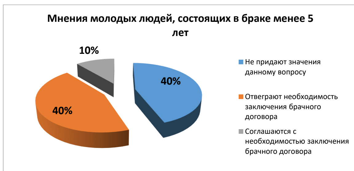
Рис. 2 Результаты опроса юношей и девушек, состоящих в браке менее 5 лет

Также нами был проведен аналогичный опрос супружеских пар, которые состоят в браке на протяжении первых пяти лет (50 молодых людей), который показал следующее: 20 человек отметили, что не задумывались о необходимости заключения брачного договора, поэтому затрудняются дать однозначный ответ на этот вопрос. Помимо этого, многие юноши и девушки являются некомпетентными в вопросах правового регулирования имущественных отношений супругов, не знают, что входит в содержание брачного договора и какова его цель. 20 человек ответили, что не нуждаются в таком договоре. 10 человек отметили, что целесообразным было бы заключить брачный договор. Представим наглядно результаты опроса на рисунке 2.