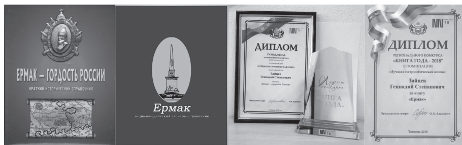
Оба издания - победители конкурса «Книга года» (г. Тюмень)