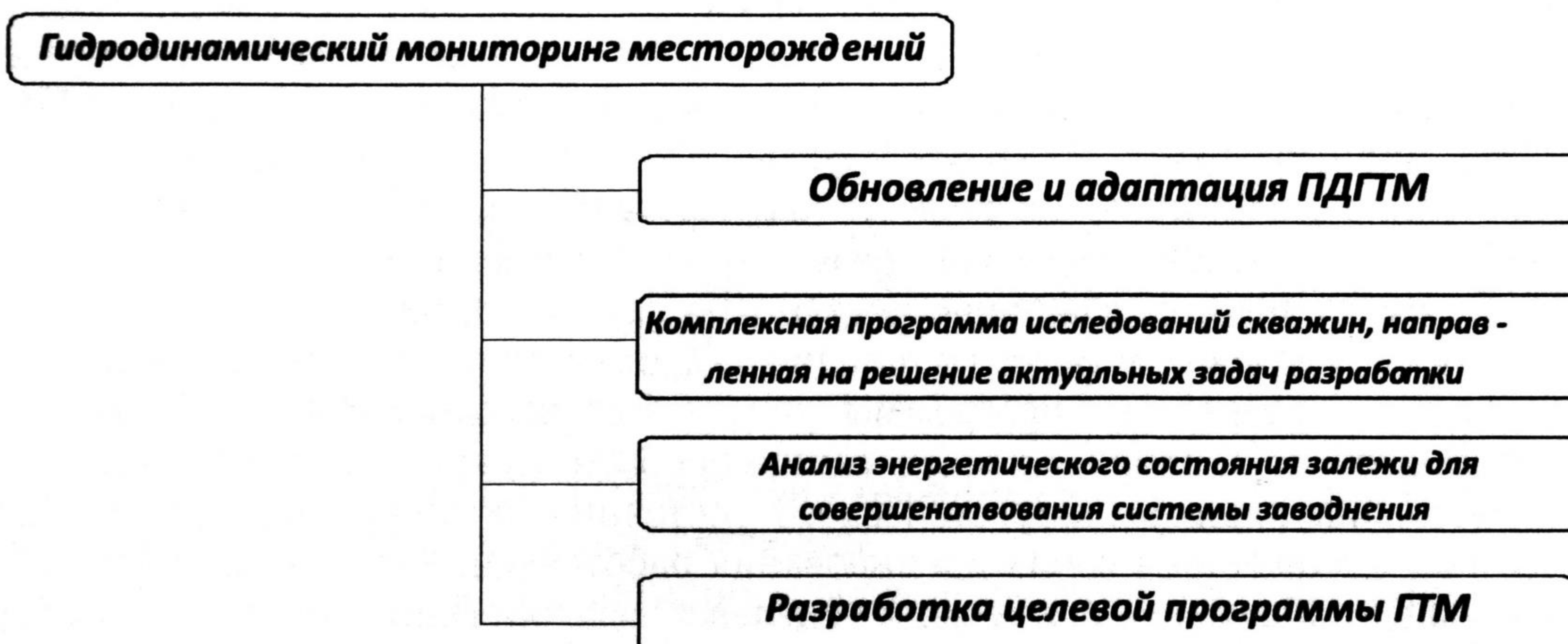
Рис. 1. Концепция гидродинамического мониторинга месторождений

Степень изученности залежей в большинстве случаев крайне неравномерна как по площади, так и по запасам. Гидродинамические исследования позволяют уточнить геологическое строение объектов разработки, а также снизить неопределенности в определении петрофизических параметров пласта. Основная проблема заключается в определении минимального объема исследований, а следовательно, и минимальных потерь добычи и опорной сетки исследуемых скважин для получения максимального количества необходимой информации.