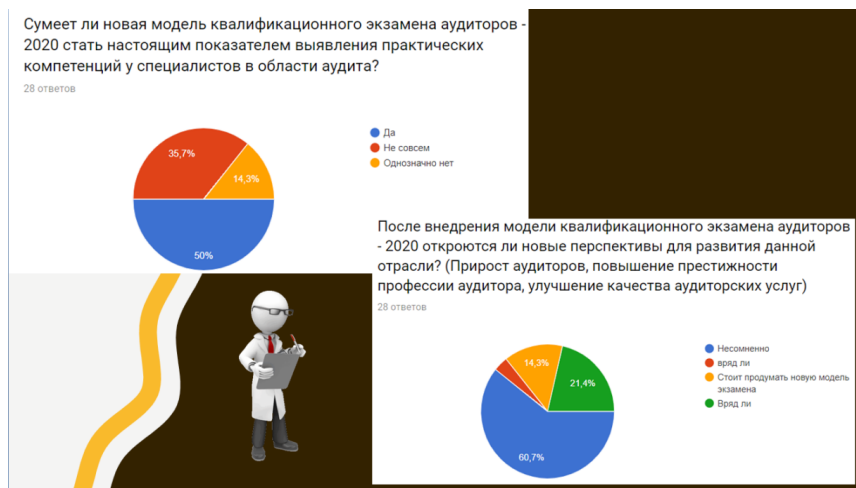
Рис. 4. Результаты опроса представителей аудиторской компании «Е&У»

внедрение нововведений позволит открыть совершенно новые перспективы развития данной отрасли.