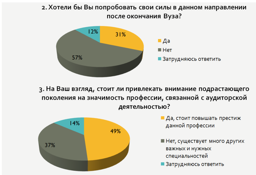
Рис. 3. Результаты опроса студентов старших курсов экономического направления Тюменского государственного университета

б) разумное сочетание обеспечения качества экзамена и его финансовой состоятельности для претендентов [2, с. 17].