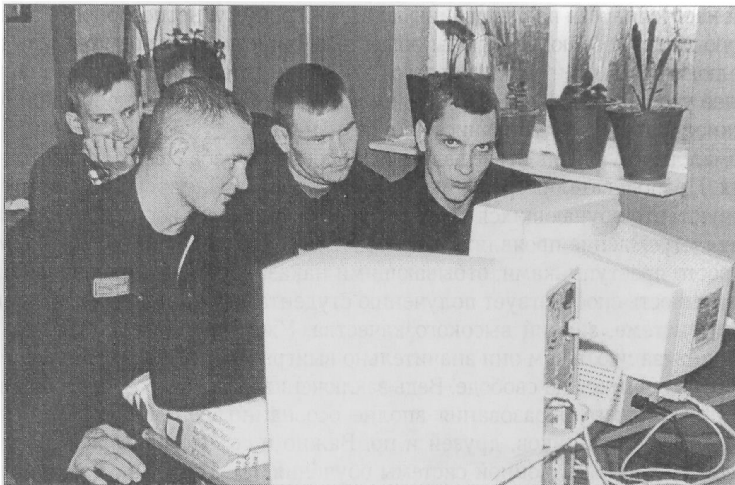
Рис. 2. Компьютерные занятия в ИУ № 5

Как известно, лишение свободы и тяжелые условия отбывания наказания в пенитенциарной системе являются серьезным дистрессом для человека. Агрессивная среда, жесткие условия и ограничения жизнедеятельности, почти полный разрыв основных социальных связей — все это является тяжелыми психотравмирующими факторами.