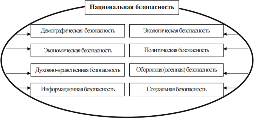
Рис. 3. Угрозы в структуре национальной безопасности

Отдельно экономисты выделяют виды угроз, связанные с определенной сферой деятельности, которые в своей сумме определяют национальную безопасность (рис. 3).