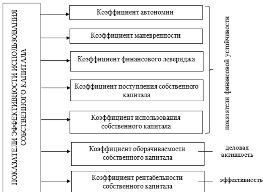
Рис. 4. Показатели определения уровня эффективности использования собственного капитала

При анализе собственного капитала рассчитываются следующие показатели эффективности использования собственного капитала (рис. 4). Формулы нахождения перечисленных коэффициентов широко описаны в специальной литературе.