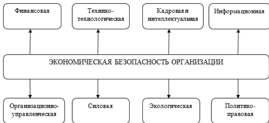
Рис. 1. Структурные элементы экономической безопасности организации

Деятельность организации в современных условиях формируется под влиянием различных аспектов, которые могут, как благоприятно отражаться на его функционировании, так и отрицательно. Именно поэтому источниками угроз, рисков и опасностей могут быть различные явления. Целесообразно рассматривать их в соответствии со структурными элементами экономической безопасности организации, которые даны на рис. 1.