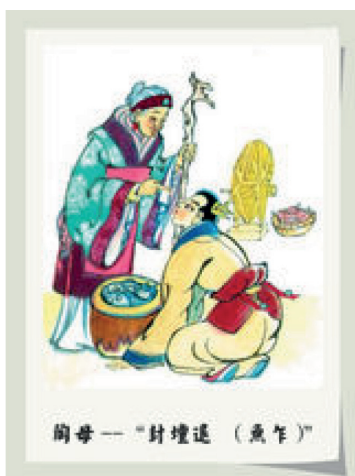
Рис. 3. «Мать Тао закрывает глиняную баночку с рыбой и возвращает подарок». Художник неизвестен

Мать Оуян также овдовела. Это случилось, когда ее сыну было четыре года, и ей пришлось в одиночку кормить и воспитывать сына (рис. 4). Когда отец Оуян Сю был жив, жизненные условия в семье были относительно богатыми, но после его смерти положение семьи резко ухудшилось. Со временем у семьи не осталось даже собственного дома или своей земли, которую можно было бы возделывать.