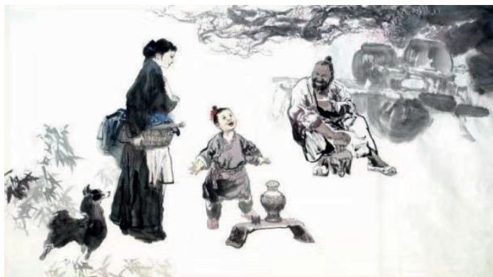
Рис. 1. «Мать Конфуция Янь Чжэнцзай учит сына». Художник Го Дефу (ок. 1949 г., июнь), г. Шэньян Источник: [29].

История о подготовке матерью сына — в будущем великого мыслителя и просветителя Конфуция — в конце периода Чуньцю в Китае малоизвестна. На самом деле мать Конфуция Янь Чжэнцзай сыграла большую роль в воспитании и развитии Конфуция в детстве, была его первым учителем (рис. 1) [9].