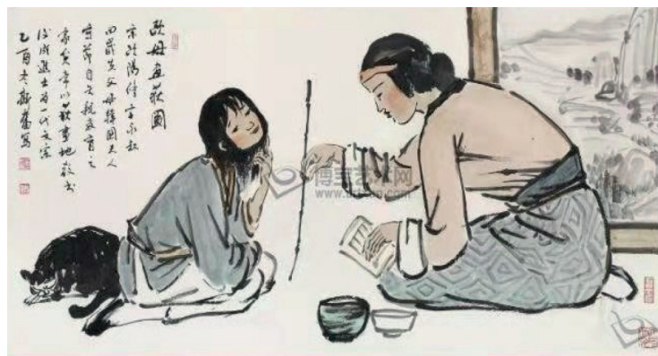
Рис. 4. «Мать Оуян Сю учит сына». Художник Го Дефу (ок. 1949 г., июнь), г. Шэньян Источник: [29].