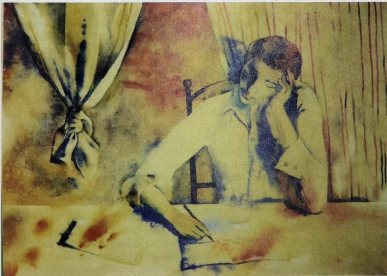
О. Трофимова. ВЕЧЕР, ПИСЬМО

В обществе, по единодушному мнению исследователей, «отмечается тенденция к прагматизации чтения, которое нередко меняет масштаб и/или принимает