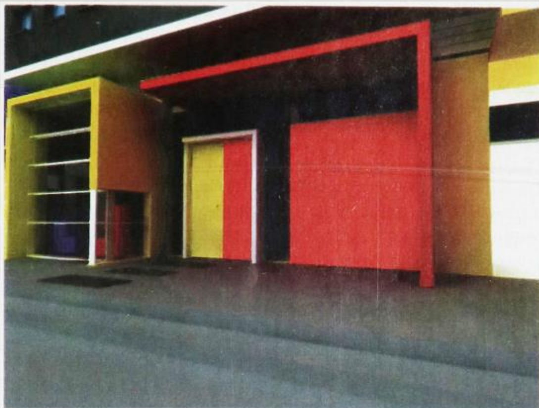
пригла Макарова. ДЕТСКАЯ ХУДОЖЕСТВЕННАЯ ШКОЛА № 1 /гипнотический проект/

рАм тАмо шышок насо- бирАла (Шм.), с трём друзьям в гОрот уйЭхал (Н.); с четырьём робе- тишкам лЕтось управ- лялася — навезУт вНУ- коф мнЕ (Чнт.), одИн с четырьём лошАткам шОл с рыбой ф ТобОльско (Б-Т), пЕли четырьём го- лосАм (Уш.), хтО минЯ посАдит ф транвАйэ с четырьём-то узлАм (Н.), с четырьём лесИнам на- силу упрАвились — пи- лили да колОли (Шм.), с четырьём рублям ф кармане, дАк ково кУ- пиш (Мл.).