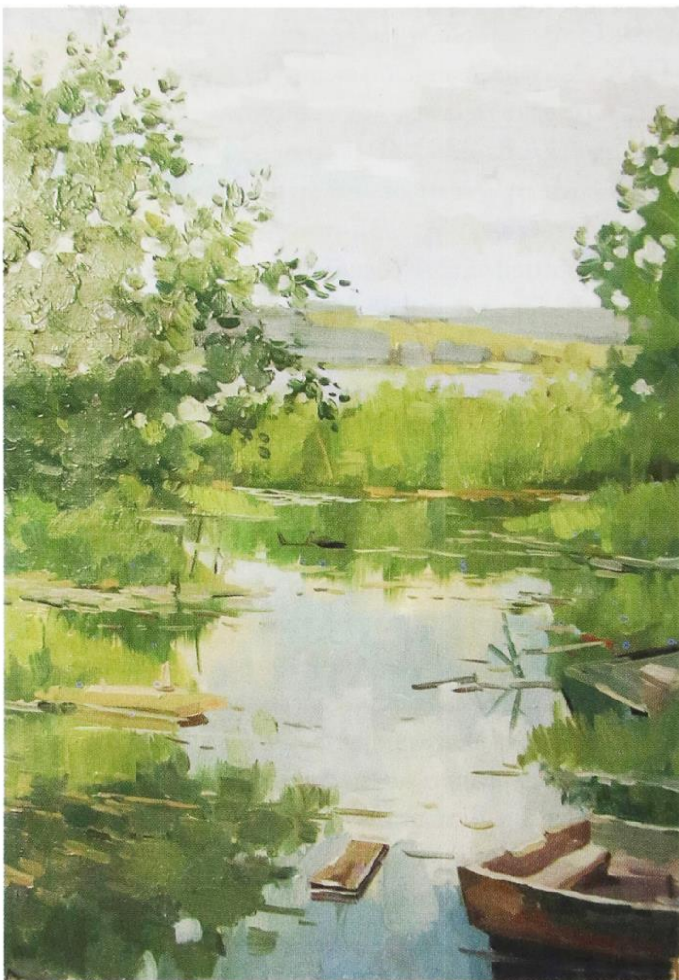
А. Васильев. Озеро. 2004

Как и в литературном языке [Русская грамматика 1980: 578], во всех косвенных падежах, кроме вин. падежа, в исследуемых говорах употребляется единая форма на —А: род. пад. — кОло сорокА копЁшок наскреблИ (Стн.), до сорокА грАдусоф холодА стойАли (Тр.), килОметров до девенОста на невадникЕ хлЮпали водОй (М.), до девенОста рублЕй у йэвО дОлгу-ту накапИлася (Тн.), дО