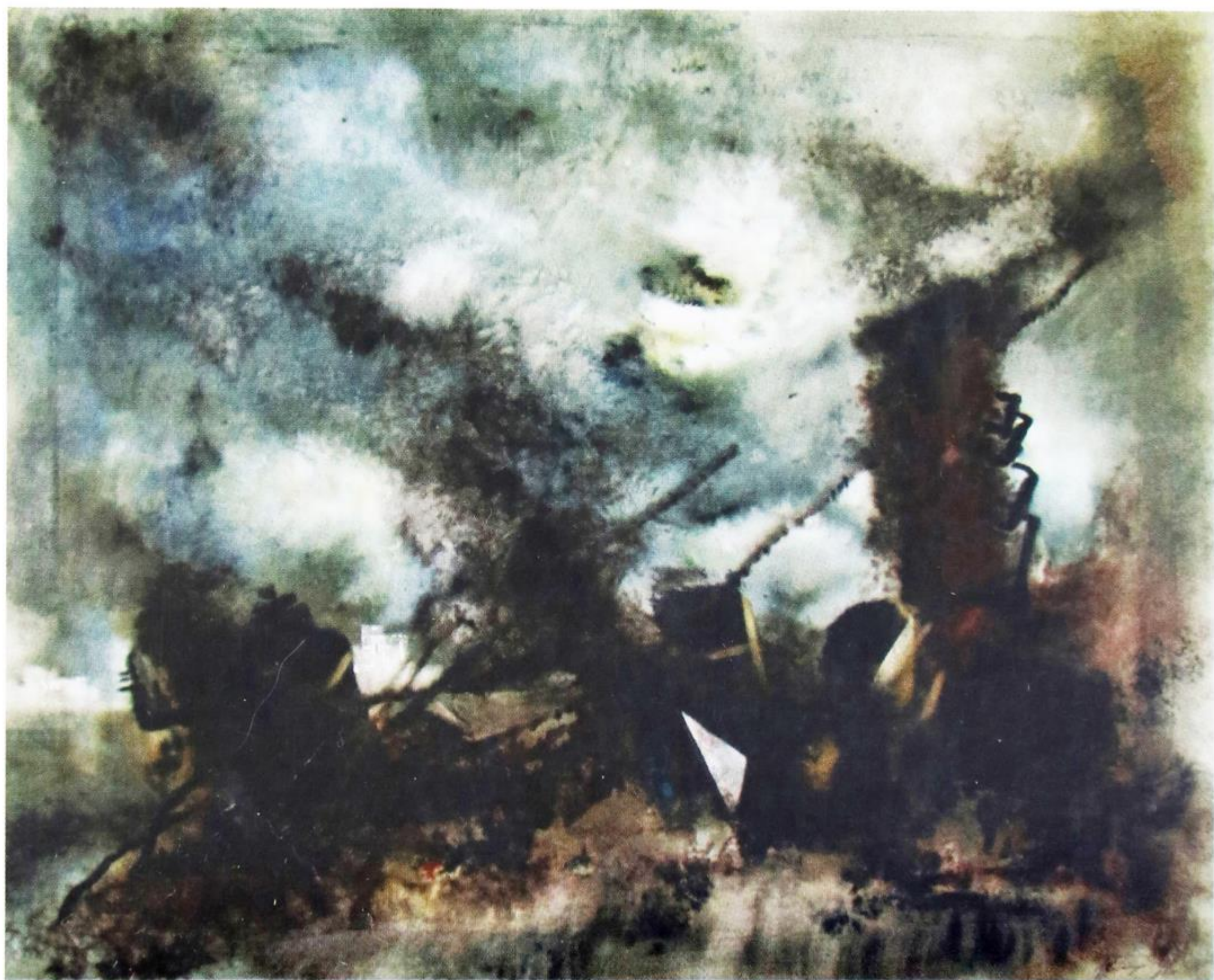
И. Щетинин. Раны земли. 1991