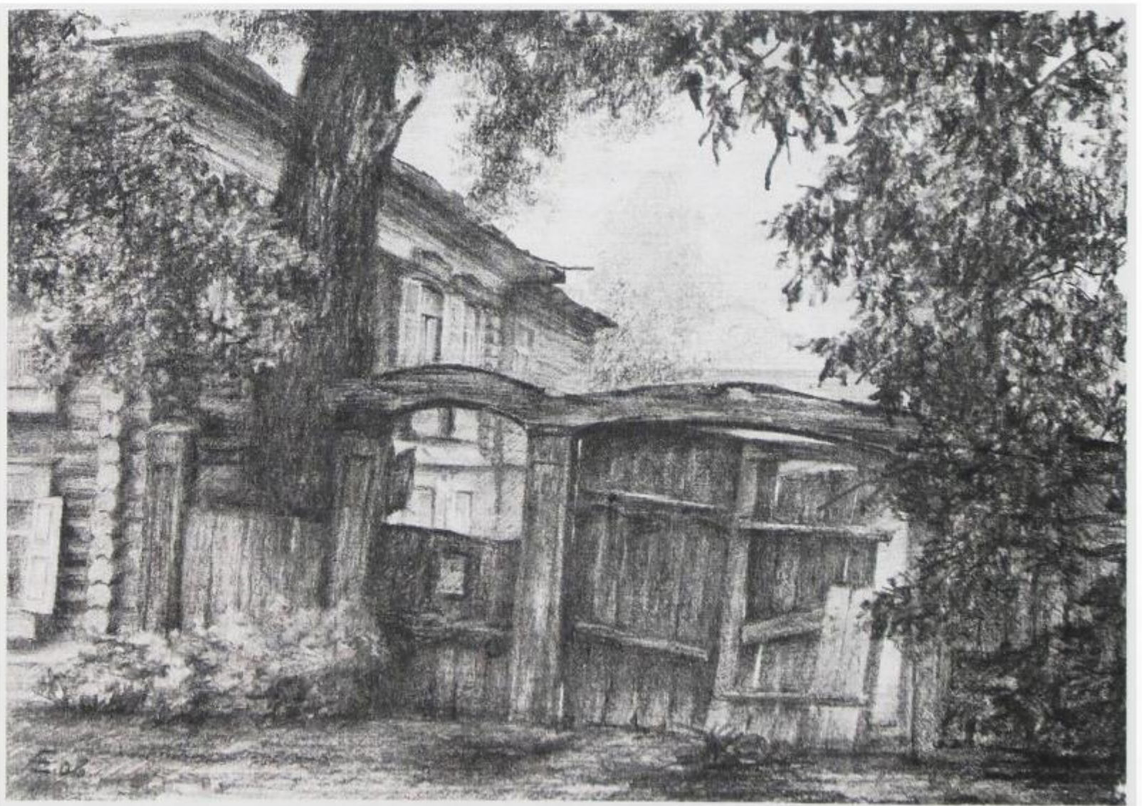
А. Ердяков. ТЮМЕНЬ. 2006

Морфологические и синтаксические черты: в системе именных форм — наличие двух типов склонения имен существительных — мужеско-среднего ( у мальчИшка , з дЕдушкой ) и женского ( к лошаде , ф печЕ ); образование форм множественного числа существительных мужского рода, обозначающих степени родства, с суффиксом -ова- (-ева-) ( братовйА , зятевйА ); наличие стяженных форм прилагательных и глаголов ( зла собака , простУ кринку , пустО ведро ; знаш , пластАт , игрАм , согрЕм ); ударение на окончании в форме