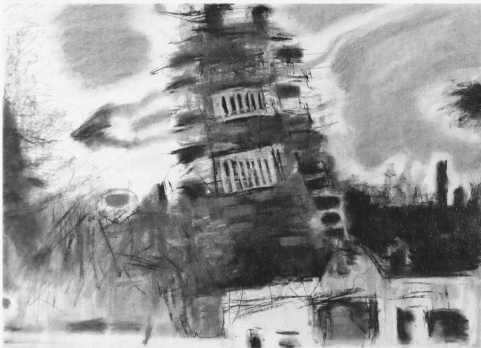
С. Мокроусов. АрхиТип. ТЮМЕНЬ. ЛИСТ 6. 2012

Если разбираться в американской идентичности и ее отношении к понятиям о центре и регионе, то, в отличие от русской, в ней преобладает весьма сильное, ясно очерченное региональное сознание. Тут далеко не все дороги ведут в Рим — или же, в американском случае, в Вашингтон, округ Колумбии. Вашингтон даже называют территорией «внутри кольцевой дороги», где жители лелеют преувеличенное ощущение собственного значения для остальной страны. И регионы играют бóльшую историческую роль в идентичности, чем жительство в каком-нибудь определенном штате. Эта черта имеет свои исторические корни — разные люди из разных стран и регионов мира заселили разные территории в разные времена. Так, на исходе