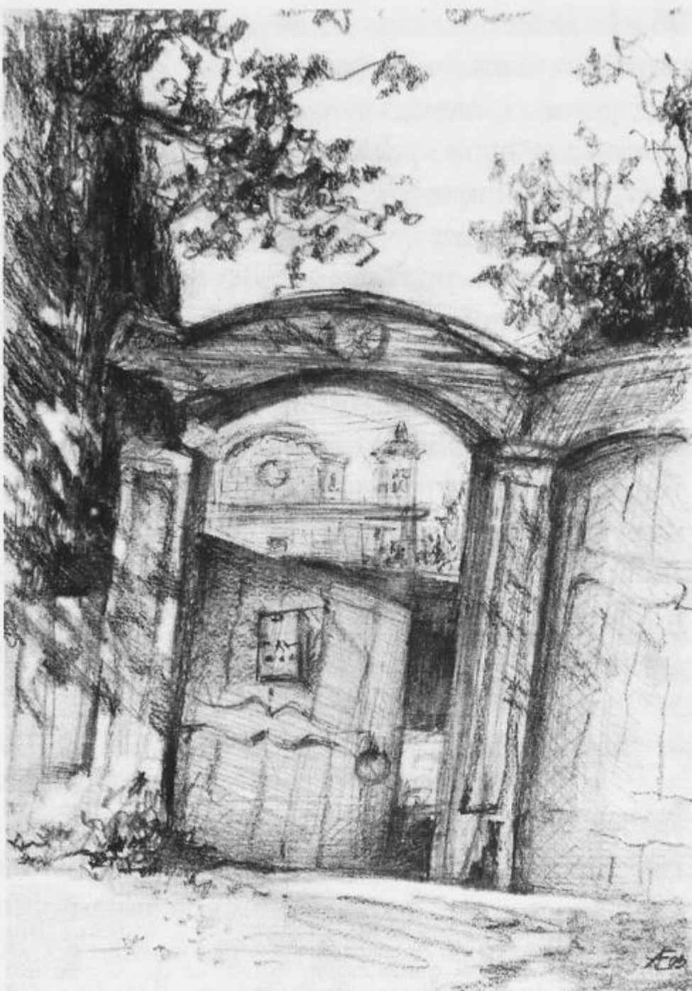
А. Ердяков. ТЮМЕНЬ. 2003

религии, прилежный предприниматель, в основном белый мужчина) и теми, кто опровергает мнение, что эти добродетели присущи одним белым мужчинам европейского происхождения. С одной стороны, такие, как Хантингтон, считают, что Америка была построена трудолюбивыми, набожными белыми мужчинами, что явно не так. Можно даже предположить, что эта узкая, предвзятая ментальность содействует отделению богатых от остальных, постройке так называемых запертых районов («gated communities») для сравнительно зажиточных американцев.