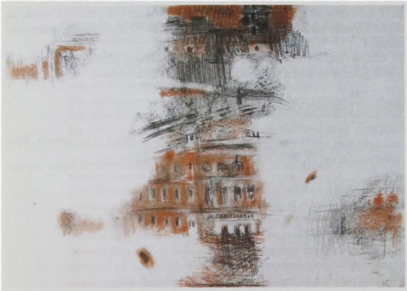
С. Мокроусов. АрхиТип. ТЮМЕНЬ. ЛИСТ 4. 2012

П. Сокальский, рецензируя оперу на страницах «Санкт-Петербургских ведомостей», отмечал: «Композитор (он же и либреттист), исполнявший