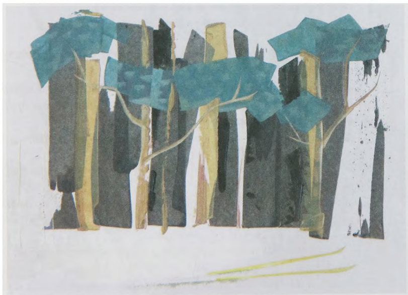
С. Перепелкин. ПРО ГОРОД: ЛЫЖНАЯ ПРОГУЛКА 2. 2016