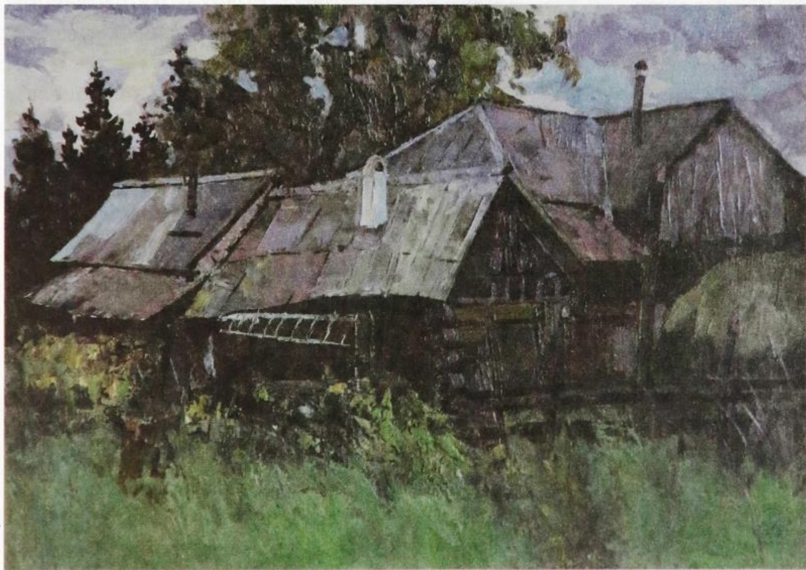
М. М. Гардубей. ОКРАИНА с. ЗЫРЯНКА. 2002

Городу в сопоставлениях Городницкого часто приписывается человеческое настроение, состояние, возможность испытывать и выражать чувства. При этом город может обособляться от его жителей или «быть заодно» с