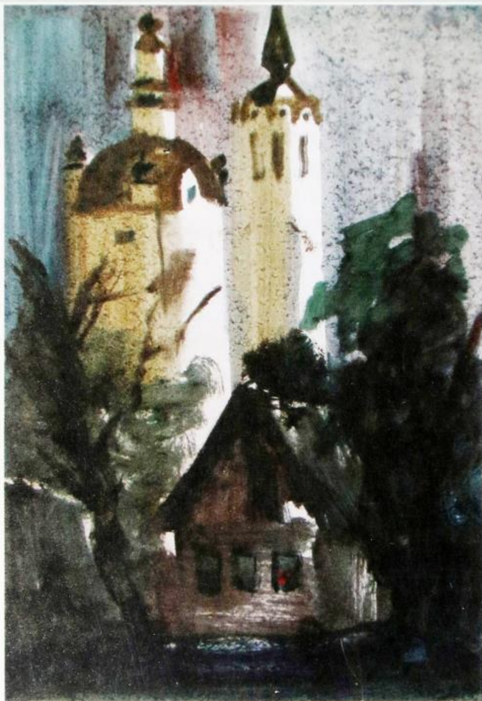
И. Щетинин. ПЕЙЗАЖ С ХРАМОМ. 2005

смотра-конкурса; были организованы тематические выставки-витрины сельскохозяйственной литературы и изопродукции; комплектовались библиотечки для специалистов сельскохозяйственного производства; проводились выставки-продажи литературы в совхозах, на рыбных промыслах и местах каслания оленеводов; к распространению сельскохозяйственной литературы активно привлекались общественные распространители и члены школьных кооперативов «Юные друзья книги». Смотр проводился в магазине «Книги». Магазин работает по методу самообслуживания. Привлекались общественные распространители, которые занимались прода-